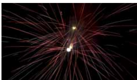
Program osláv 750. výročia prvej písomnej zmenky o obci bol zavŕšený ohňostrojom