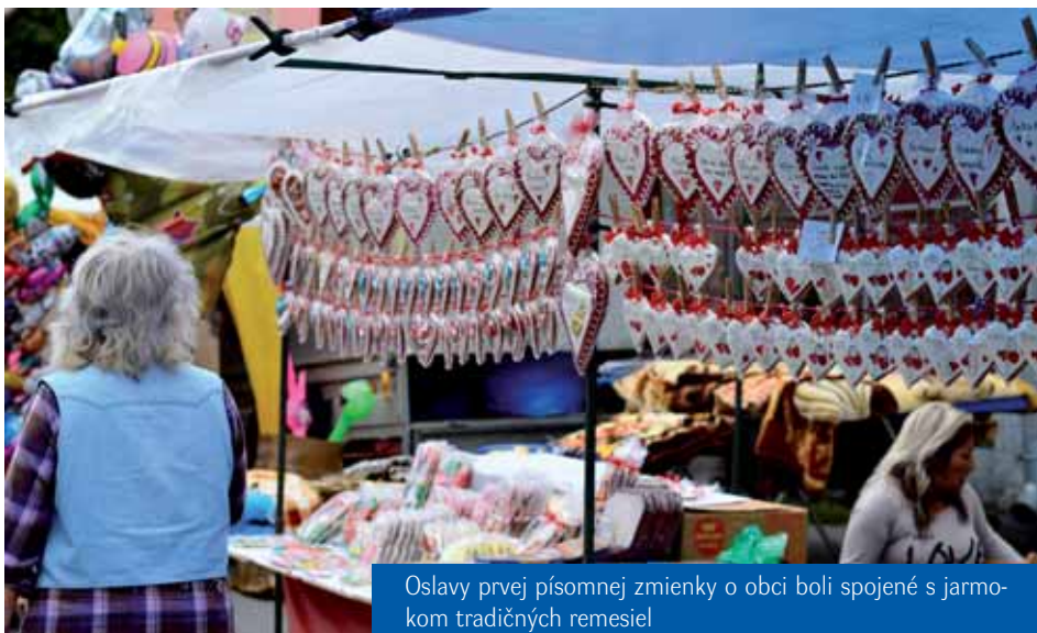
Oslavy prvej písomnej zmienky o obci boli spojené s jarmokom tradičných remesiel