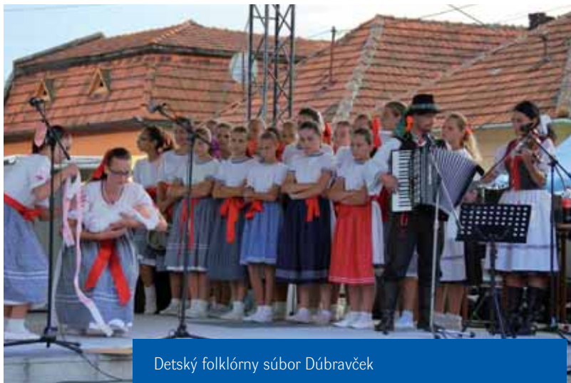
Detský folklórny súbor Dúbravček