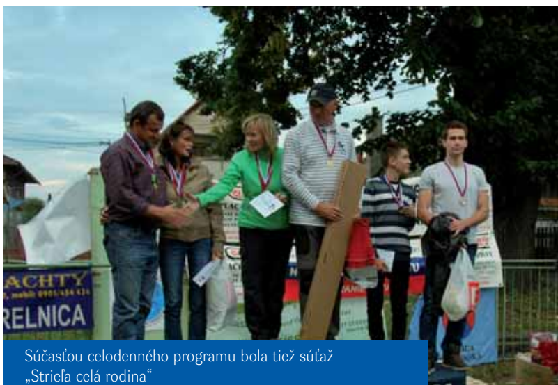
Súčasťou celodenného programu bola tiež súťaž „Strieľa celá rodina“