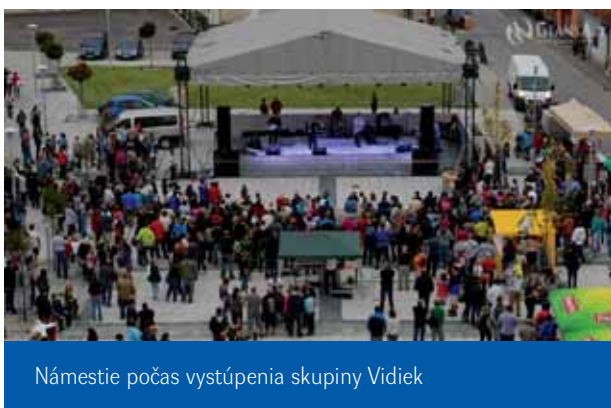
Námestie počas vystúpenia skupiny Vidiek