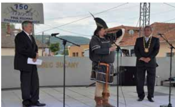
Starosta obce prevzal kópiu historickej listiny

K prejavom historického povedomia, lokálpatriotizmu a hrdosti patrí aj pripomenutie si historicky určujúcich, zlomových či kľúčových udalostí viazaných k miestu, s ktorým sme spätí. Významné, okrúhle a dátumovo čo najstaršie výročia takýchto udalostí bývajú teda spravidla aj dôvodom vyjadrenia istej úcty dôstojnou a udalosti primeranou pripomienkou. Sú to akési pomyselné míľniky na cestách značených históriou nám blízkeho miesta, mesta, obce. Je to čas na zamyslenie sa o minulosti pre budúcnosť, tiež aby sa upevnila naša hrdosť na predchádzajúce dejiny a generácie, čo tieto dejiny pred nami vytvárali.