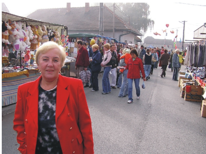
Z jarmočnej atmosféry