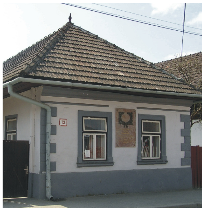
Rodný dom Juraja Langsfelda s tabuľou - kultúrna pamiatka

Kultúrnohistorický význam má latinský predhovor k zbierke, ktorý predstavuje obranu slovenského a slovenského národa a jazyka, čím ho možno zaradiť medzi prvých, ktorí sa snažili slovenský jazyk pozdvihnúť. Zanechal aj pokus o slovenskú gramatiku, "protož jako mluvíme, tak i psati máme". Daniel Sinapius Horčička patril k najväčším literárnym a kultúrnym zjavom 17. storočia. Stál na začiatku cesty od latinčiny a biblickej češtiny k slovenčine. Jeho pokračovateľmi boli D. Krman, A. Doležal (pochovaný v ev. kostole v Sučanoch), A. Bernolák, na konci cesty je dnešná slovenčina.