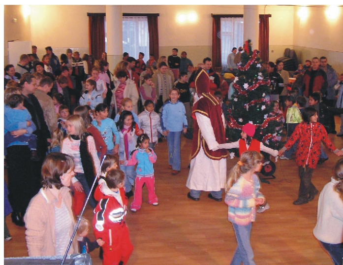
Mikuláš v RKD