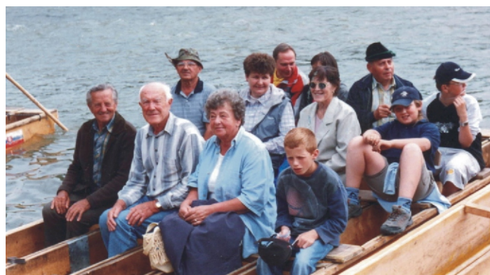
Členovia JDS pri splavovaní Dunajca