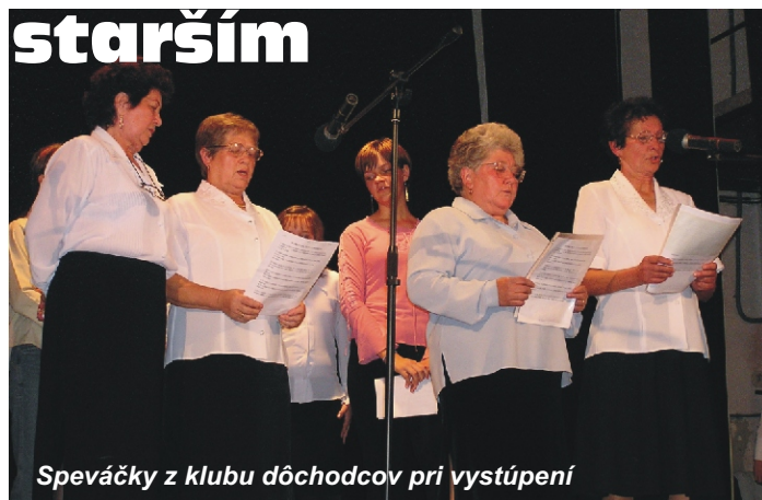
Speváčky z klubu dôchodcov pri vystúpení