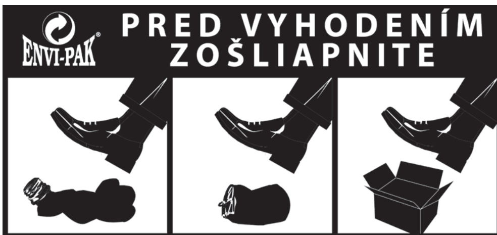
FOTO: Pred vyhodením plastových fliaš, plechoviek, škatúl a nápojových kartónov zmenšíte ich objem.

Ak nezačneme za susedov ich odpad upravovať, teda zo smetnej nádoby vyberať, fľaše alebo škatule zošliapávať, aby nezaberali veľa vzduchu, polystyrén lámať a podobne, neraz to skončí tak, že položíme naše po-