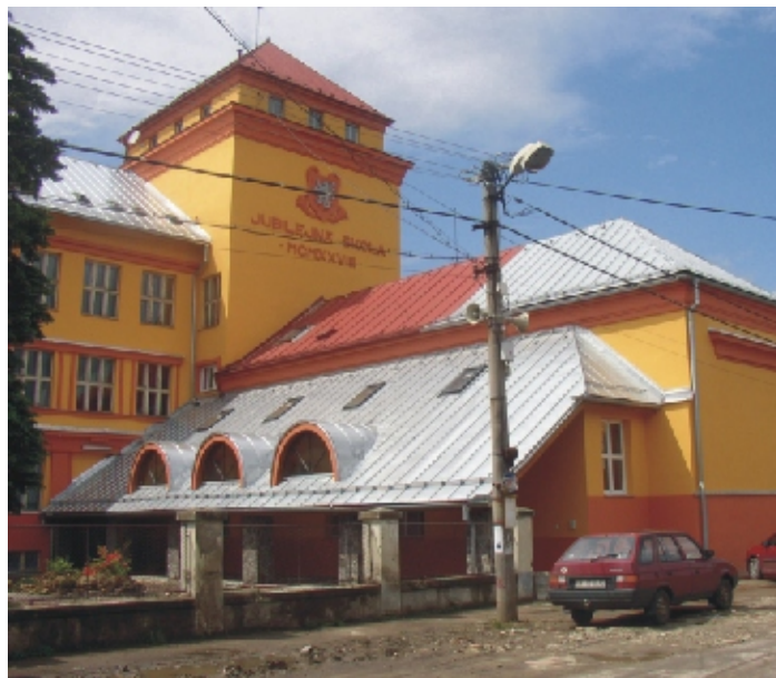
Foto - budova GBAS po rekonštrukcii