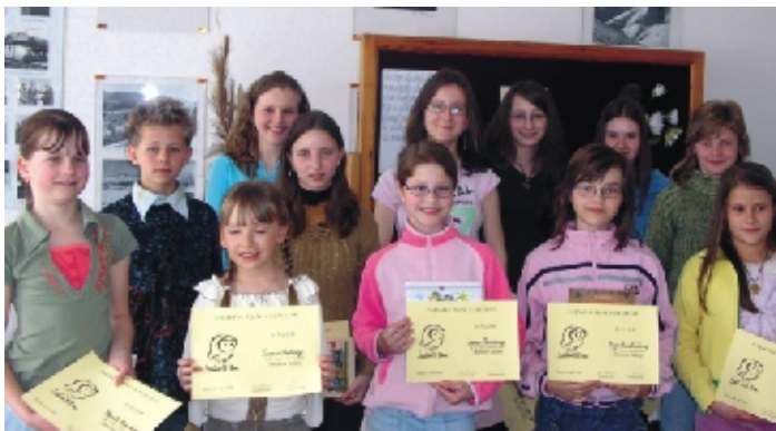
Foto - ocenení žiaci