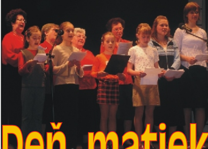
Foto - z vystúpenia v RKD