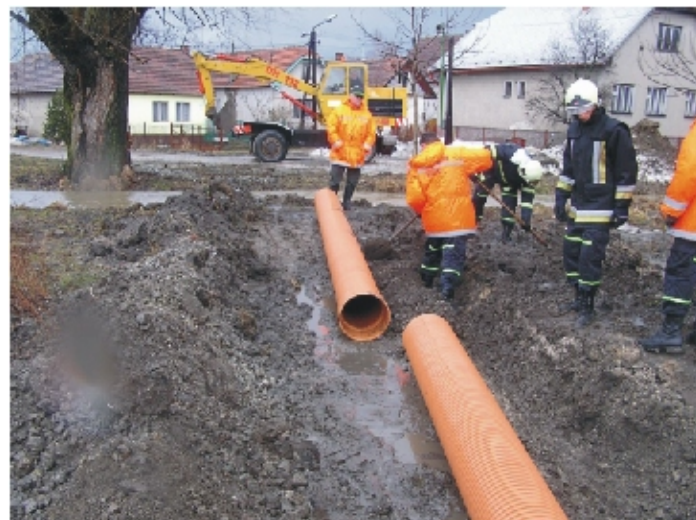
Foto - pracovníci obce pri jarných povodniach