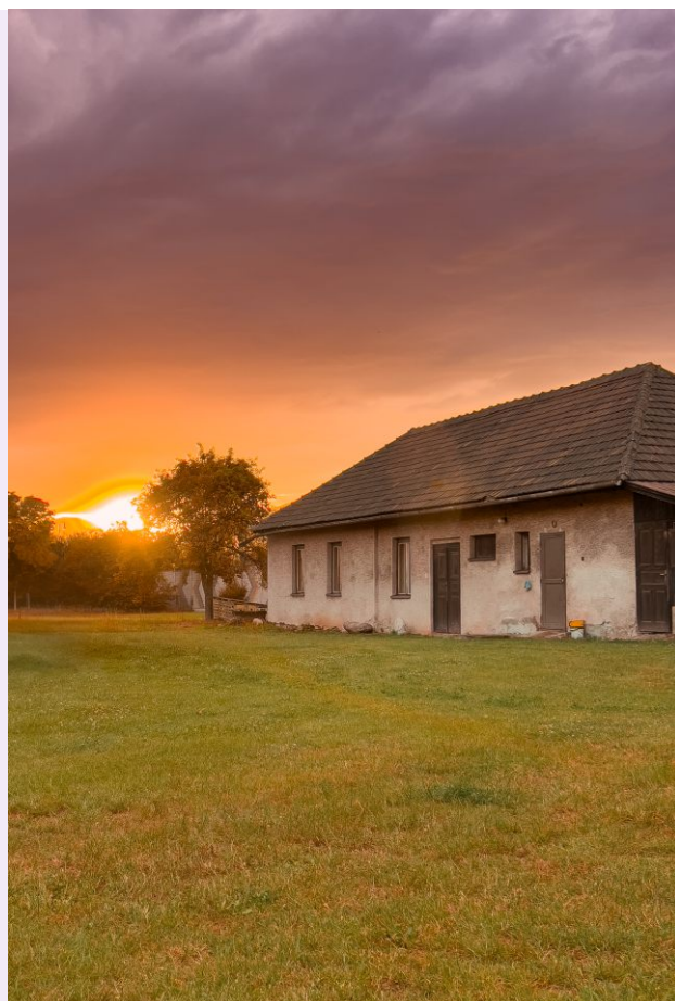
Západ slnka na fare v Sučanoch