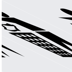
Obr. 2 Grafické zobrazenie panáčika so zbernou nádobou

Okrem týchto informačných symbolov sa na plastových obaloch nachádza aj grafický znázornený panáčik odhadzujúci nepotrebný obal do zbernej nádoby (obr.2).